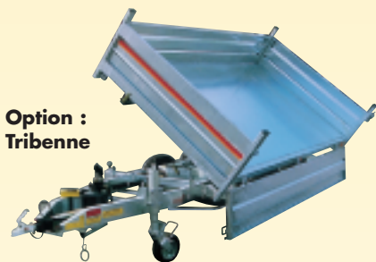
Option : Tribenne