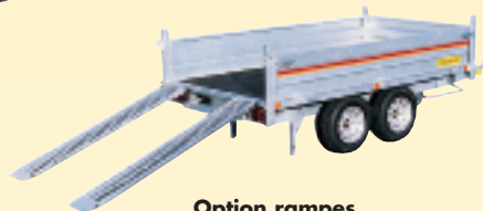
Option rampes de montée et béquilles