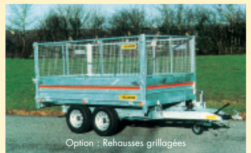
Option : Réhausses grillagées