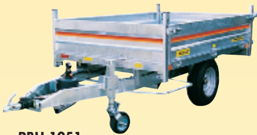
RBH 1051 (1 essieu)