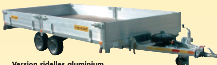
Version ridelles aluminium