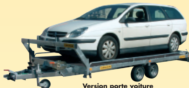
Version porte voiture