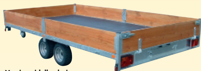
Version ridelles bois