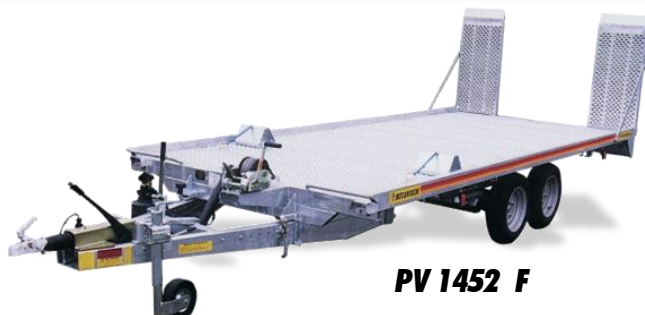
PV 1452 F