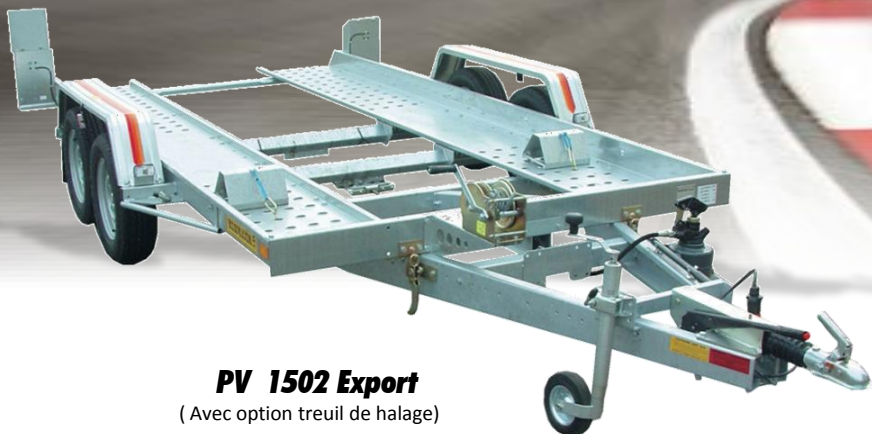
PV 1502 Export