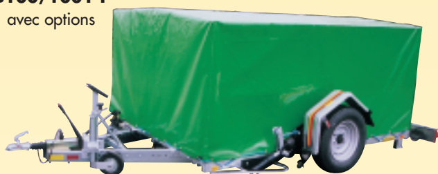
B100/1001 F avec options