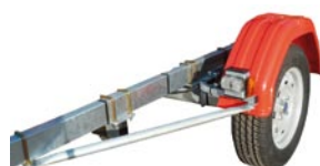
Garde-boue polyéthylène et pare cyclistes

*Remorque équipée d'un système de freinage à inertie et recul automatique