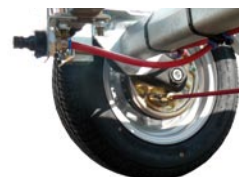
Kit de rinçage des tambours en option