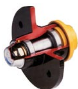
Roulement de moyeux étanche