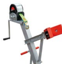
Potence de treuil