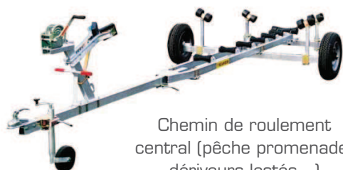
Chemin de roulement central (pêche promenade, dérivateurs lestés...)