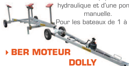
► BER MOTEUR DOLLY

Ensemble composé d'un manuber et d'un chariot de manutention équipé d'un vérin hydraulique et d'une pompe manuelle. Pour les bateaux de 1 à 4 T.